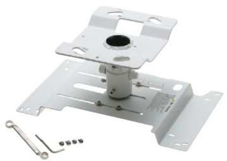
Support plafond sur mesure : installation aisée et sûre